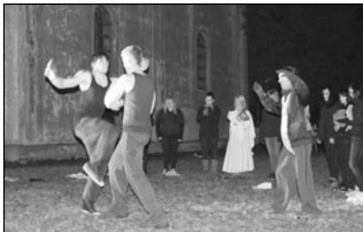
Etuda v podaní účastníkov divadelnej dielne počas Oscarovej noci.