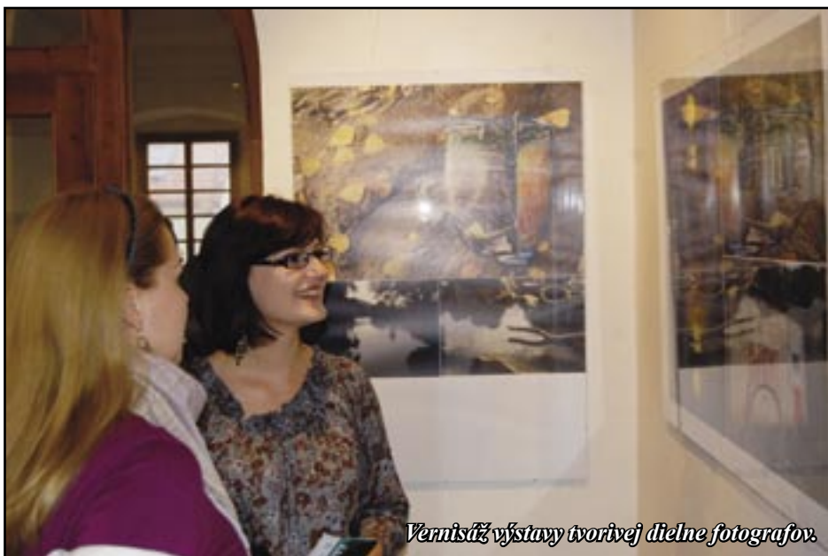
Vernisáž výstavy tvorivej dielne fotografikov.

Oscarový film Obchod na Korze znova v Sabinove ožil. Postarali sa o to organizátori, účastníci, ale aj návštevníci podujatia OSCAR CITY, ktoré sa konalo v našom meste od 24. do 28. októbra. Pripravená bola celá séria akcií spojená s témou slávneho filmu.