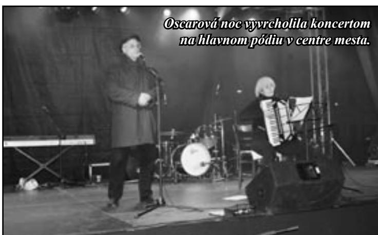
Oscarová noc vyvrcholila koncertom na hlavnom pódiu v centre mesta.