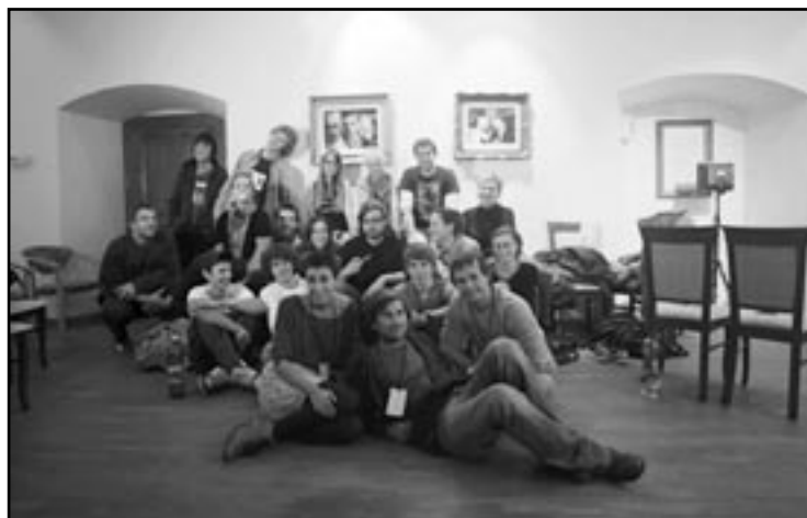
Účastníci filmovej tvorivej dielne.

Priestor na realizáciu dostali aj deti počas tvorivých dielní Street Art, premietal sa samozrejme nezabudnuteľný film Obchod na korze... Projekt mestského kultúrneho strediska Oscarové mesto Sabinov 2011 podporilo aj Ministerstvo kultúry SR a realizoval sa v spoluprá-