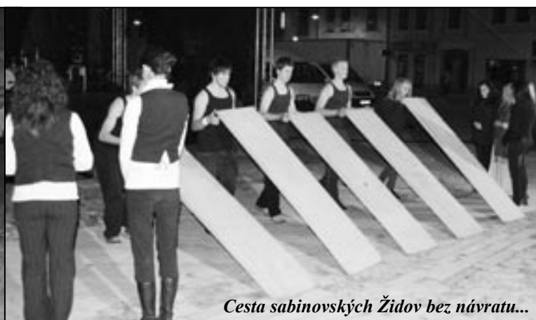
Cesta sabinovských Židov bez návratu...