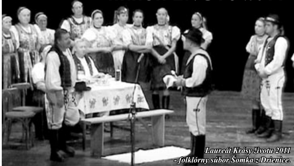
Laureát Kráasy Životu 2011 - folklórny súbor Šomka z Drienice.

V Mestskom kultúrnom stredisku v Sabinove sa 23. októbra konal v poradí už 37. ročník regionálnej súťažnej prehliadky folklórnych skupín z okresov Prešov a Sabinov - KRÁSA ŽIVOTU.