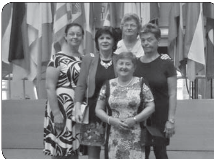
fotografovaní sme sa s pani europoslankyňou rozlúčili.

V jeden deň sme toho stihli dosť, získali sme nové skúsenosti a poznatky, za čo ešte raz ďakujeme. ◀◀