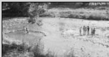
V horúcich letných dňoch poskytovala príjemné osvieženie aj blízka Torysa.