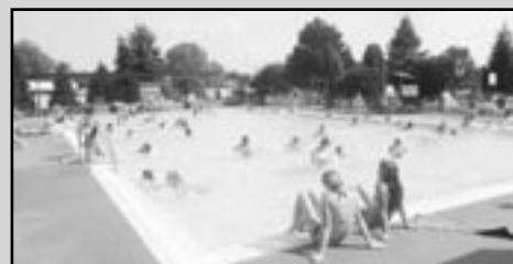
Sabinovské kúpalisko láka okrem domácich aj cezpoľných návštevníkov.