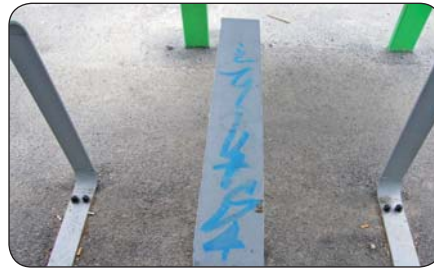
15.6.2020 - stojan na bicykle

Písať o tom, že pri letmom pozretí sa na fotografie vidieť, ako sme nepoučiteľní, by bolo asi zbytočné. Tohto roku už vyšli dva „vandalské“ články o sabinovskom úseku cyklomagistrály Eurovelo 11, a ako vidieť, mína sa to účinku. Aký príklad dávame a akú vizitku ukazujeme sebe, ale aj cyklistom z okolia, to netreba ani komentovať. Nad niečím sa však pozastavme. Všimnite si, že často počúvame ponosy, ako je možné, že ešte pred kolaudáciou je v oblasti cyklochodníka špina. Pri lavičkách si fajčiari urobia provizórny popolník. Ako inak, najlepšie na zem. Krabička od cigariet, fľaše lacného alkoholu dotvárajú „príjemný“ kolorit tohto, nami vytváraného životného prostredia. Cyklisti a mamičky