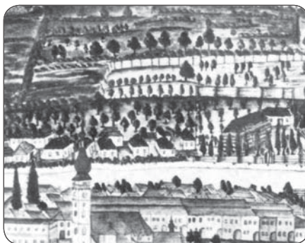
Detail rytiny Sabinova z roku 1816, na ktorej vidieť rozsiahle ovocné sady.

Keďže v Sabinove a okolí sa vypestovalo nadbytok ovocia, uvažovalo sa, ako s ním nakladať. Časť šla na export, sušilo sa, spracovávalo na marmelády a pod. Zvyšok bol využívaný v primitívnych domácich páleniciach (do začiatku 19. storočia sa u nás z alkoholických nápojov užívalo len víno a pivo). Tieto aktivity však mali živelný charakter. To sa však