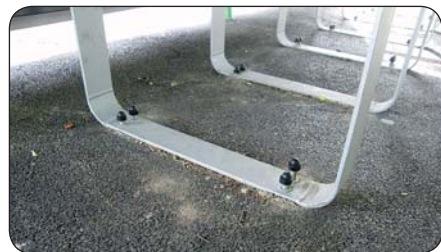
10.6.2020 - pokus o ukradnutie stojanov na bicykle

im niečo doma chýba, nejaký stavebný prvok, a ten „rastie“ pri cyklochodníku, prípadne si chcú vylepšiť vlastnú finančnú situáciu návštevou zberne železa, lebo niektoré stojany sú už nielen postriekané od sprejerov, ale časť už je uvoľnených a pripravené sú na „zrýchlený presun“. Samozrejme, nikto nič nevidel a ani nepočul a potom na vine sú nie vandali, ale policajti, ktorí by zrejme mali byť všade. A bude zaujímavé pri prípadnej krádeži zistiť, ak k nej teda dôjde, či zberne železa tento verejnoprospešný prvok od občana zoberú. Ďalším osobitným a zvlášť nebezpečným ukazovateľom sú milovníci rýchlych kolies, ktorí si urobil z cyklochodníka autostrádu. Bude treba osadiť zábrany proti vstupu motorových vozidiel do areálu pre chodcov a cyklistov, lebo zdá sa, vodiči neovládajú pravidlá cestnej premávky, aj keď by to mala byť samozrejmosť. Až tak ďaleko sme „pokročili“, že prioritou je bezohľadnosť, ignorácia, vlastná pohodlnosť. Otázkou je, ak každý nadáva, kto potom túto neplech robí. Odkiaľ majú teda ľudia príklad ničť dielo, ktoré má slúžiť nám všetkým? Po „domácej karanténe“ mnohým narástli krídla a voľnosť