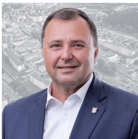
Michal Repaský - primátor Sabinova