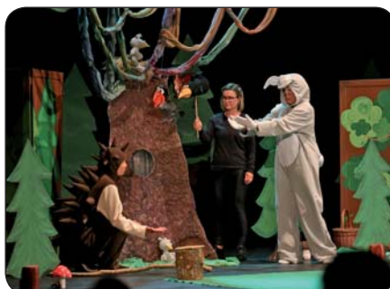
13 | Premiéra rozprávky Bábkový súbor Halabala oslávil desaťročnicu