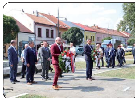
11 | 80. výročie SNP Pripomenuli sme si ozbrojený boj našich predkov proti tyranii