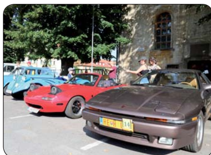
10 | Veterány v Sabinove Priaznivci historických vozidiel obdivovali krásu starých áut