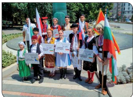
9 | Naši folkloristi v Bosne DFS Sabiník reprezentoval naše mesto v Sarajeve