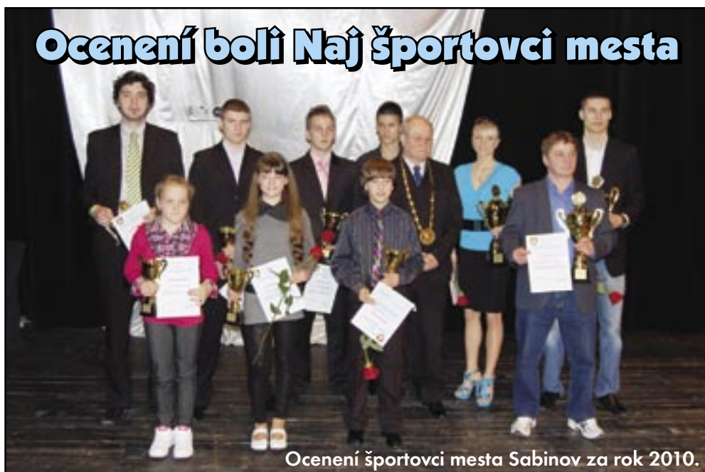
Ocenení športovci mesta Sabinov za rok 2010.