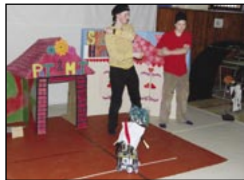
Tanec sabinovského robota a PATa a MATa.