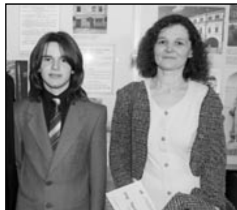
Ocenení žiaci základných škôl zo Sabinova.