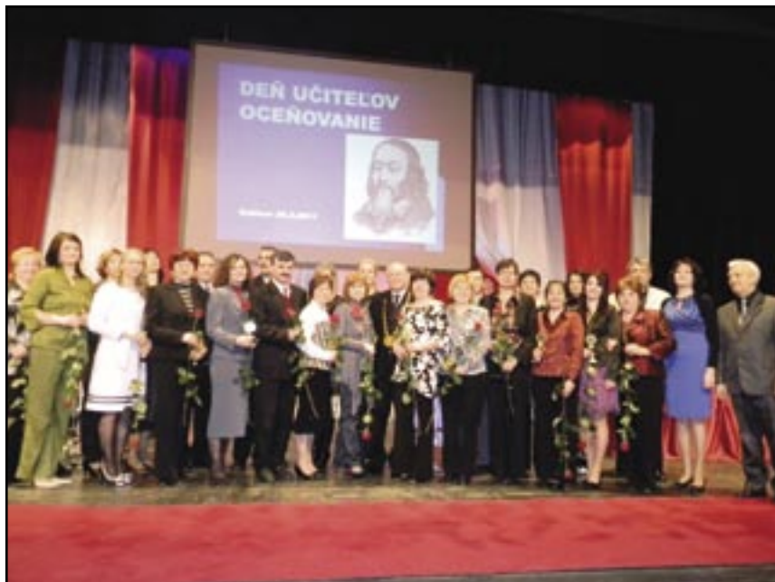
Ocenení pracovníci školstva v Sabinove.

stal od práce kuriča - údržbára aj k priamej práci s deťmi. „Primárne som správca objektu. Vďaka tomu, že som študoval pedagogiku tanca, boli využité aj tieto moje schopnosti. Keď nebol dostupný pedagóg, tak som istý čas