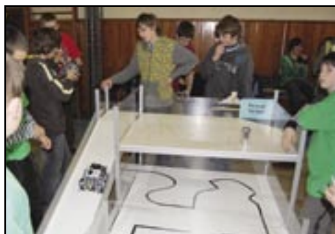
Robot záchranár v akcii.

Ide o postupovú súťaž a tí najlepší sa môžu dostať až na majstrovstvá sveta. Minulý rok to boli práve žiaci CZŠ v Sabinove, ktorí vycestovali na celosvetovú súťaž do Singapuru.