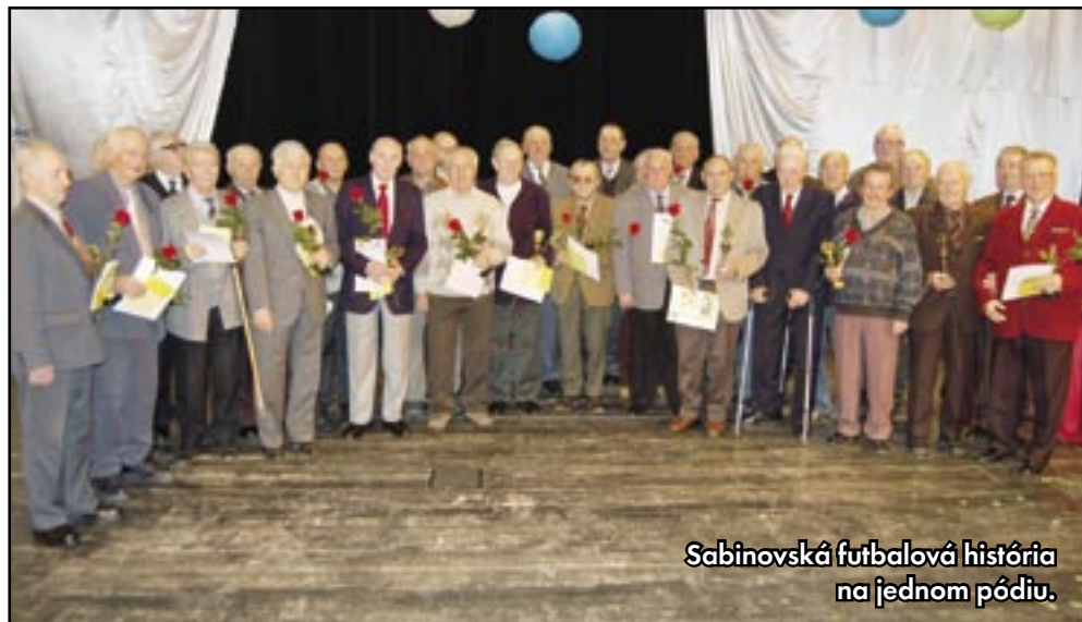
Sabinovská futbalová história na jednom pódii.