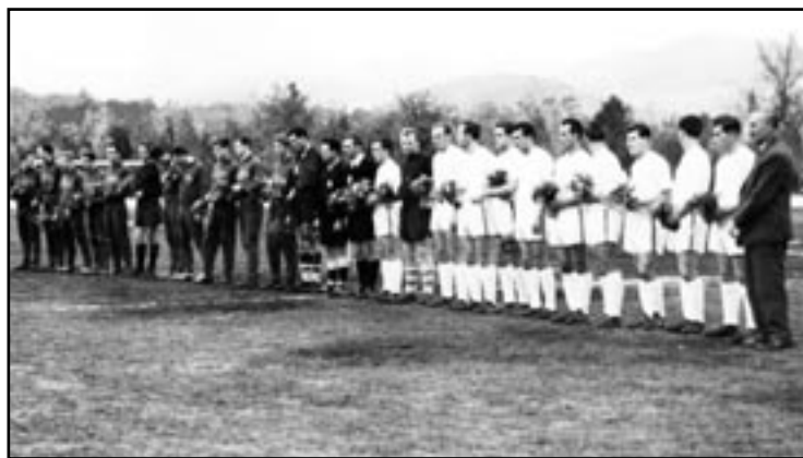
Sabinovčania (v bielom) pred zápasom s juniormi Československa.