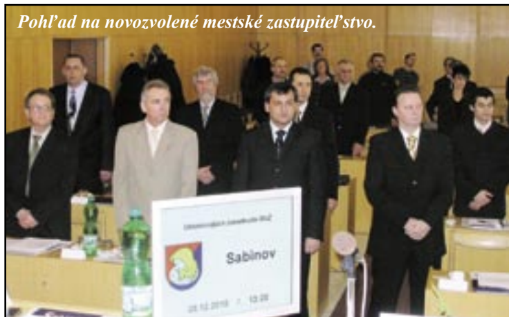
Pohľad na novozvolené mestské zastupiteľstvo.