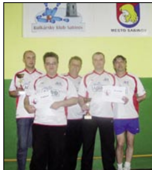
KK Sabi Sabinov víťaz 2.ligy východ.