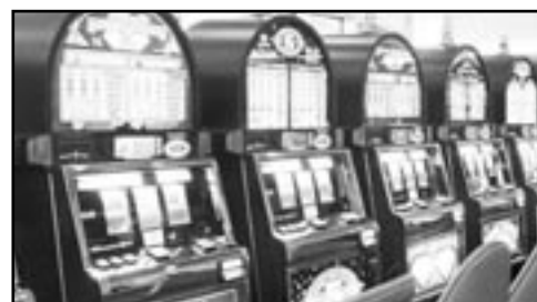
Herne budú od budúceho roka v Sabinove minulosťou.