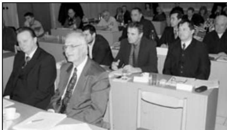
Poslanci MsZ počas rokovania 15. decembra 2011.

Mestský parlament rozhodol aj o pridelení dotácií z rozpočtu mesta na rok 2012 v prvej etape. Financie si v tomto prvom balíku rozdelí celkovo šesť subjektov, ktoré vyvíjajú činnosť na území nášho mesta. A to nasledovne: